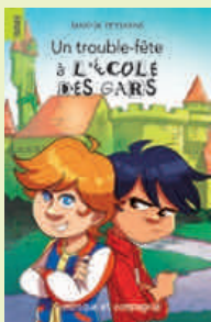
Un trouble-fête à l'École des gars 978-2-89785-266-5 96 pages • Dès 7 ans