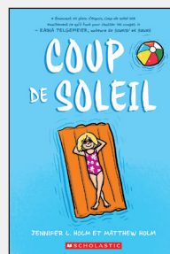
Coup de soleil 978-1-4431-5131-3