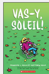
Vas-y, soleil! 978-1-4431-6862-5